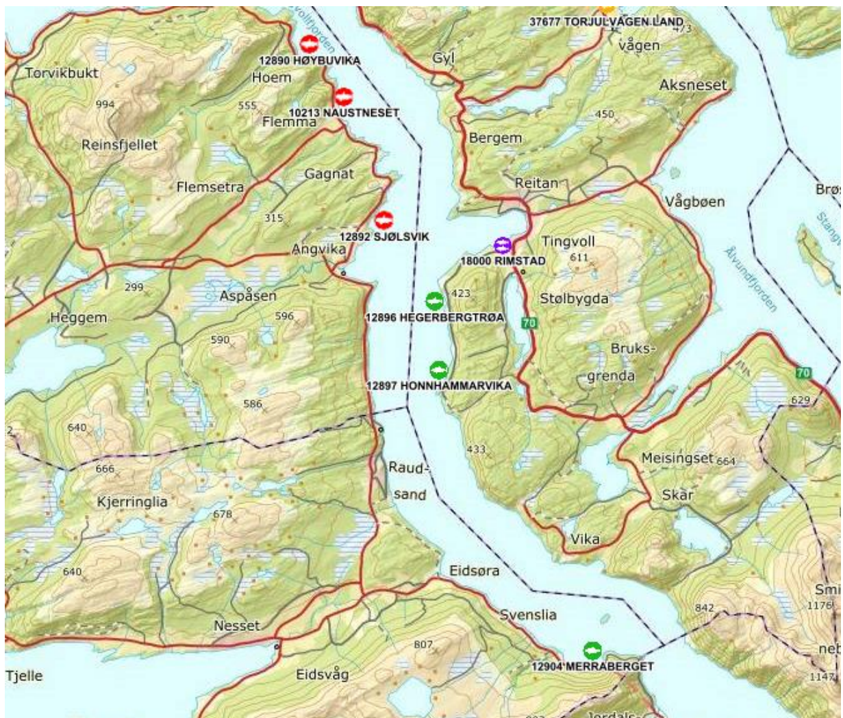
Figur 2 Oversikt over akvakulturlokaliteter i Tingvollfjorden og Sunndalsfjorden ( https://kart.fiskeridir.no/akva )